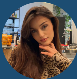
СИГАУРИ МАТА СТАЖЕР